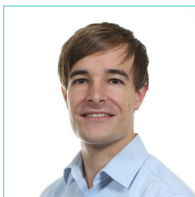
Dr. Van Parys M. schouder-, elleboog-, pols- en handchirurgie