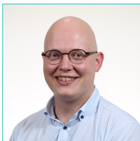
Dr. De Bo T. heup-, enkel- en voetchirurgie mcavlaanderen.wordpress.com